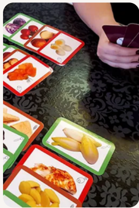
Jeux et exercices ludiques